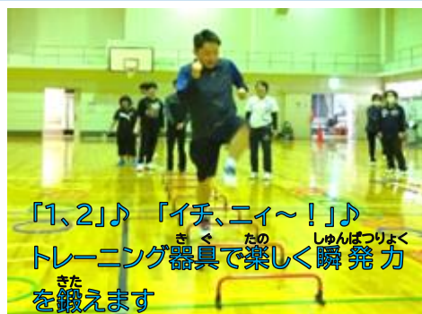
「1、2」♪ 「イチ、ニイ～!!」♪ トレーニング器具で楽しく瞬発力を鍛えます

4月27日、5月11日、18日、25日の4日間にわたり、10名の方が参加されました。陸上の基礎である、「走る・投げる・跳ぶ」の基本的なフォームや体の動かし方を様々な道具を使って学びました。最終日には「ミニ記録会」を開催し、自分の記録にチャレンジしました!!来年は、ぜひ大会にもチャレンジしてほしいです!